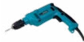
Perceuse + mèche adéquate pour le grès porcelainé. Pour réaliser des perçages, n'employer en aucun cas le mode perceur. Pour n'importe quel format.