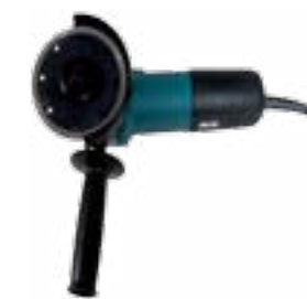
Disqueuse + disque diamant lisse.