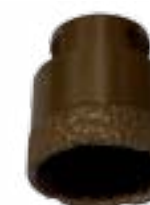
Couronne diamant. À monter sur la disqueuse. Pour n'importe quel format.