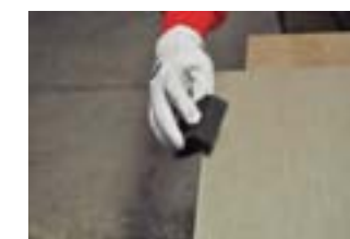
Pour un ponçage optimal, poncer le bord de la pièce en céramique à l'aide d'une éponge diamant. Procéder toujours de haut en bas, en aucun cas le long du côté.