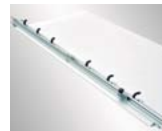
2 Guides de coupe Raimondi. Pour n'importe quel format. Recommandé pour les grands formats jusqu'à 150 x 300 cm / 59,05" x 118,11".