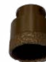
Наконечник алмазной коронки. Сцепляется с углошлифовальной машиной.