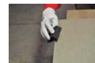
Для получения оптимальной отделки отшлифуйте край керамической плиты мочалкой с алмазной поверхностью. При этом всегда водите мочалкой сверху вниз, и никогда вбок.