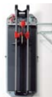
Автомат для резки (Rubi). Отформатировать до 100 x 100 см / 39,37" x 39,37".