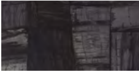
Negro Pulido Brillo / High-gloss Polished