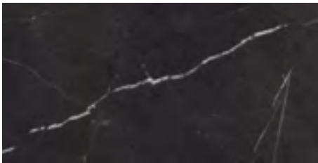
Negro Natural / Natural