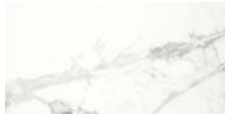
Super Blanco-Gris Pulido Mate / Matt Polished